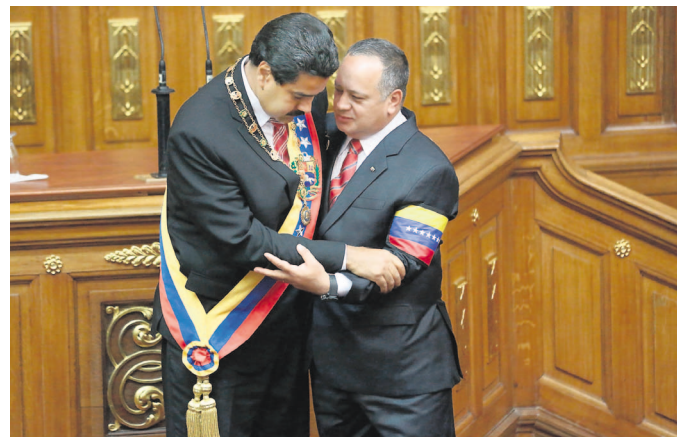
PODER. Maduro y Cabello durante la investidura presidencial, el pasado 8 de marzo.

A lo largo de una hora, Silva le plantea a Palacio lo que estima como debilidades del presidente Nicolás Maduro,