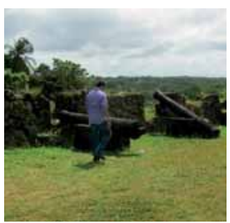
SITIO. Área del Fuerte San Lorenzo, en Portobelo, Colón.

presidente de la Asamblea Nacional, acusó a Frenadeso, al PRD y al partido Panameñista de estar detrás de las acciones de los indígenas para desestabilizar al gobierno.